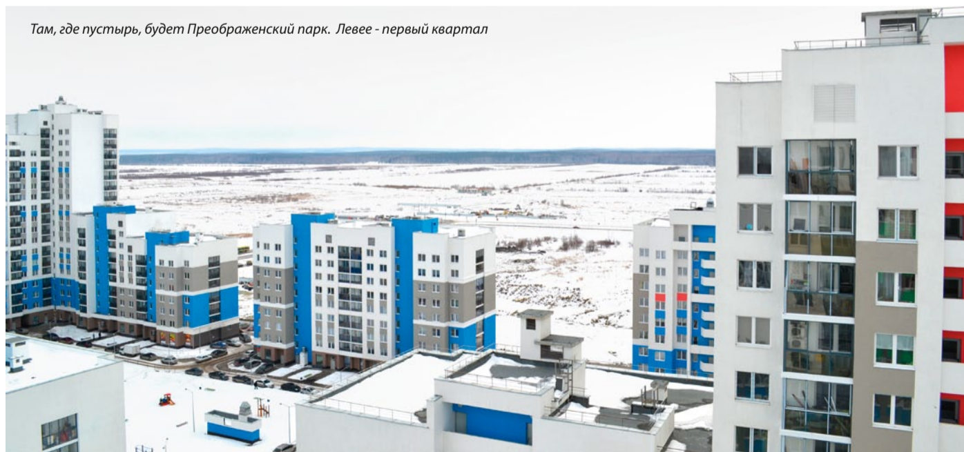
Там, где пустырь, будет Преображенский парк. Левее - первый квартал

Вместе с медицинской академией мы проработали вопрос о возможном размещении в нашем районе комплекса ее зданий. Надеюсь, в ближайшее время она будет рассмотрена градостроительным советом области. В этой части мы продолжаем наше сотрудничество с Уральским отделением академии наук и работаем над инновационным развитием территории. У них есть стратегия развития Уральского отделения академии наук, а мы думаем, как создавать условия для развития инновационных предприятий. Задача заключается в том, чтобы Академический был не просто районом для жизни, а давал его жителям возможности для творческой инновационной деятельности.