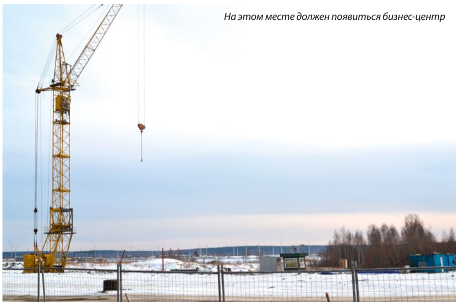
На этом месте должен появиться бизнес-центр

Хотя композиционно расположение двух зданий и школьного стадиона будет сохранено.