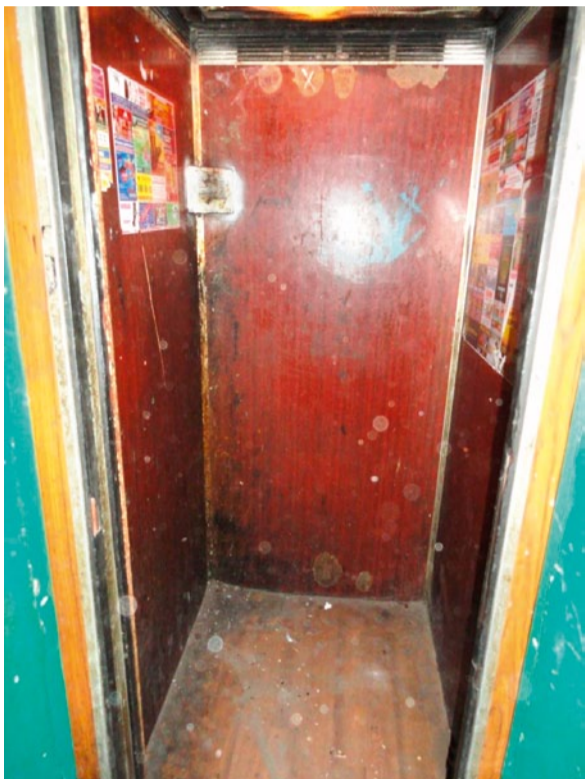
Лифт в обычном доме

Каждый новосел при заселении в Академический получает от нашей управляющей компании специальную брошюру. Она называется «Правила проживания, пользования помещениями и общим имуществом дома». Но судя по тому, как ведут себя не только новоселы, но и даже те, кто живут здесь уже год, а то и больше, становится ясно, что эти правила мало кто читал. Поэтому мы решили в серии материалов акцентировать внимание на самых важных с нашей точки зрения пунктах. Просим вас не пролистывать эту страницу, а прочитать и отнестись с пониманием. От этого зависит порядок и чистота в нашем районе.